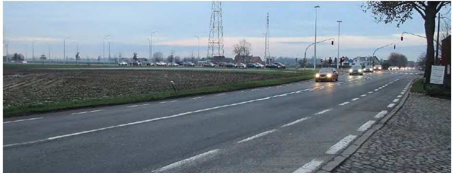
Figuur 63: N8 (Veurnseweg) richting het kruispunt met N38 (Noorderring).”

“De N8 bestaat uit twee maal één rijstrook voor gemotoriseerd verkeer en één niet-beschermd[...] fietspad, [dat van de rijstroken gescheiden is] door middel van witte streeplijnen.