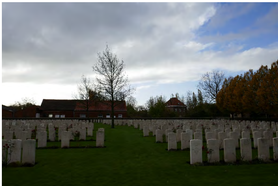
Foto 49: centraal gebied: Watertorenstraat 18 – 20 (rechts achter) en 24 (midden achter)