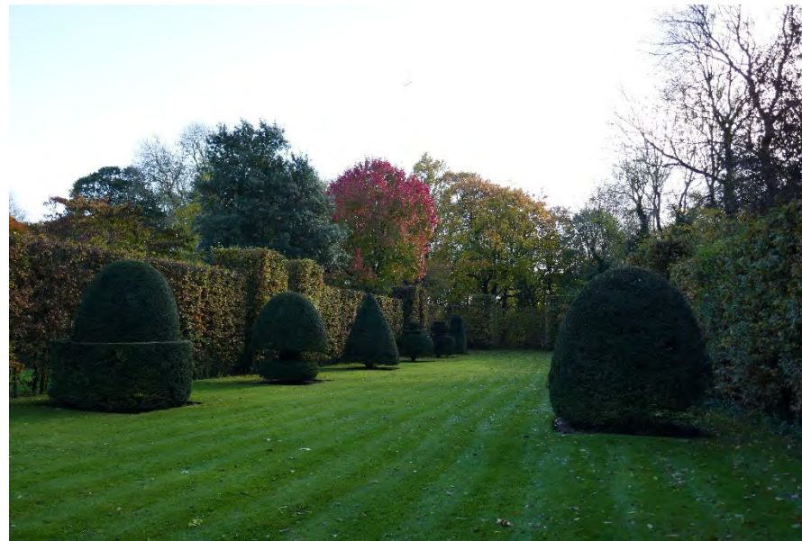
Foto 36: park Picanol met braakliggend bosgebied: tuinkamer – achterzijde landhuis