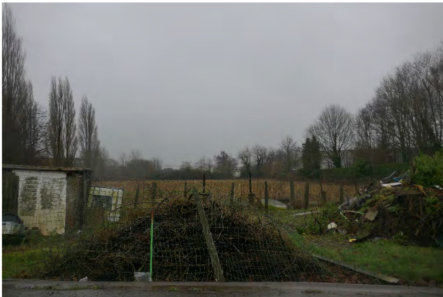
Foto 21: zone bedrijvigheid hoek Meenseweg/N8 – Steverlyncklaan: perceel 1 e afdeling sectie C nr. 42C