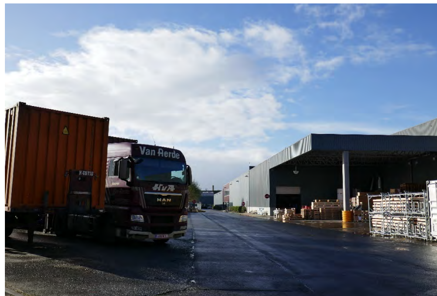
Foto 28: site Picanol: wachtruimte vrachtwagens in zuidoostelijke hoek