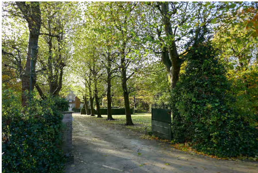
Foto 31: park Picanol met braakliggend bosgebied: oprijlaan gezien vanaf doodlopende Meenseweg/N8