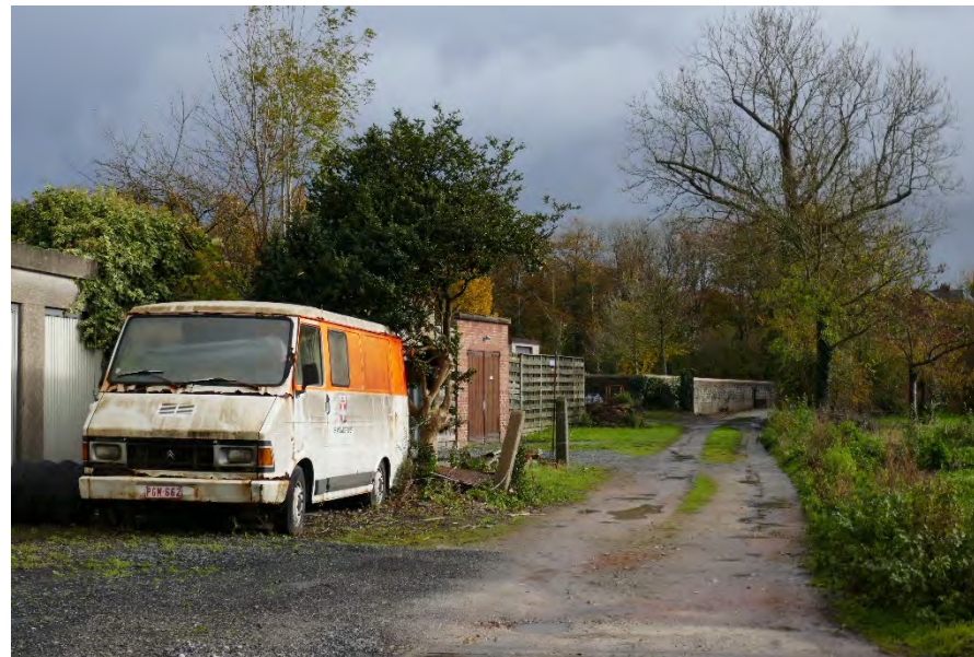
Foto 46: centraal gebied: verloederde achterzijde garages palend aan werkplaats Lemenu