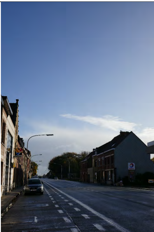
Foto 1: Meenseweg/N8 – westelijk deel: cluster van zeven aaneengeschakelde woningen