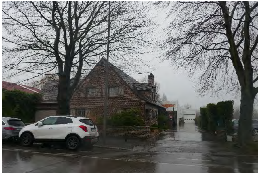
Foto 19: zone bedrijvigheid hoek Meenseweg/N8 – Steverlyncklaan: 11 en 11A – bouwonderneming Desodt