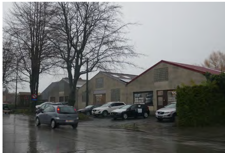
Foto 18: zone bedrijvigheid hoek Meenseweg/N8 – Steverlyncklaan: Steverlyncklaan 5, 7 en 9