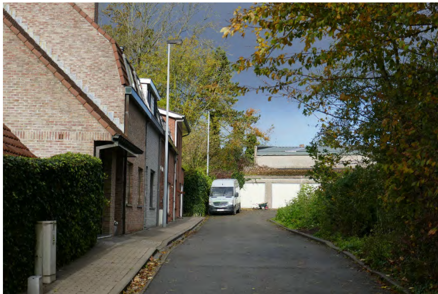
Foto 45: centraal gebied: Watertorenstraat 5 – 13 (oneven nummers) en garages palend aan werkplaats Lemenu