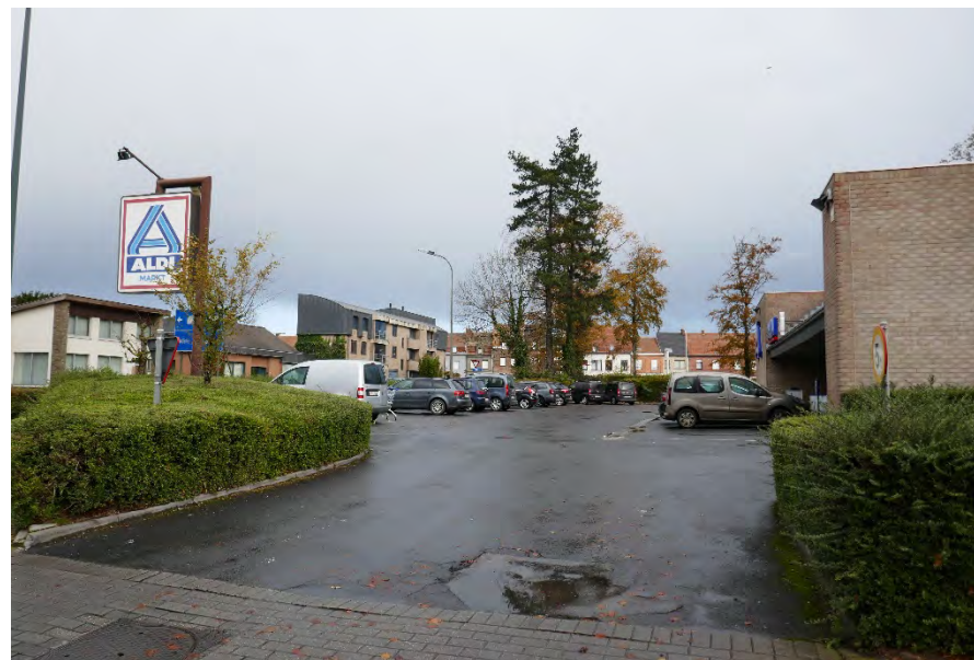
Foto 16: zone bedrijvigheid hoek Meenseweg/N8 – Steverlyncklaan: Aldi-Renmans – toegang langsheen Watertorenstraat