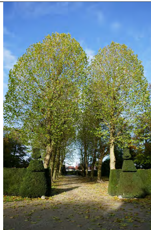
Foto 32: park Picanol met braakliggend bosgebied: oprijlaan gezien vanaf landhuis