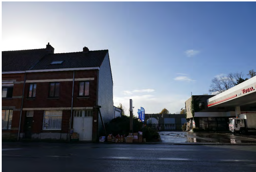
Foto 13: zone bedrijvigheid hoek Meenseweg/N8 – Steverlyncklaan: tankstation Lemenu met woning Meenseweg 128