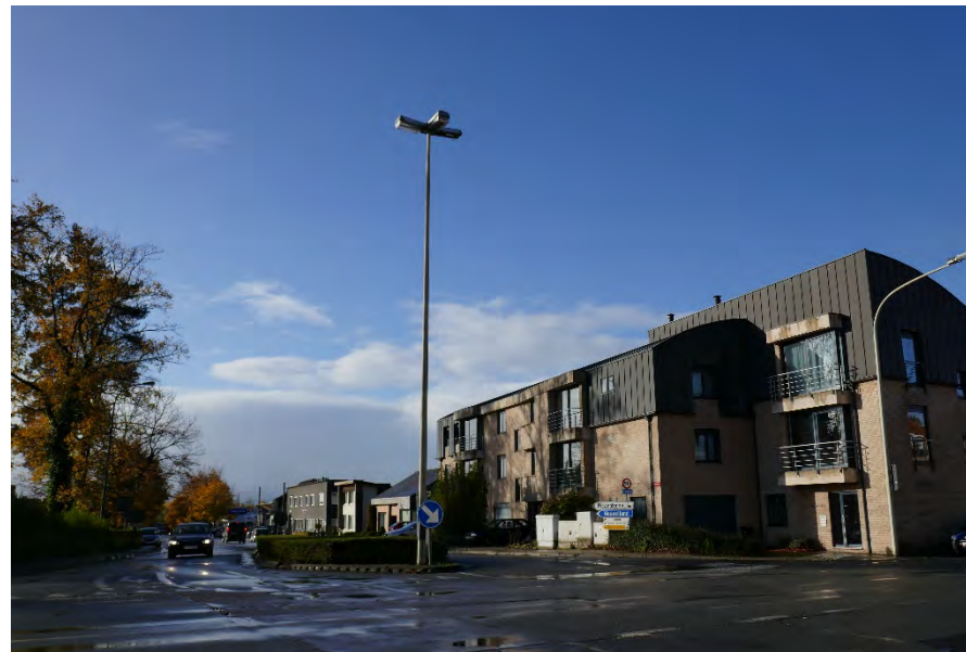
Foto 56: meergezinswoning zuidwestelijk hoek Meenseweg/N8 - Steverlyncklaan