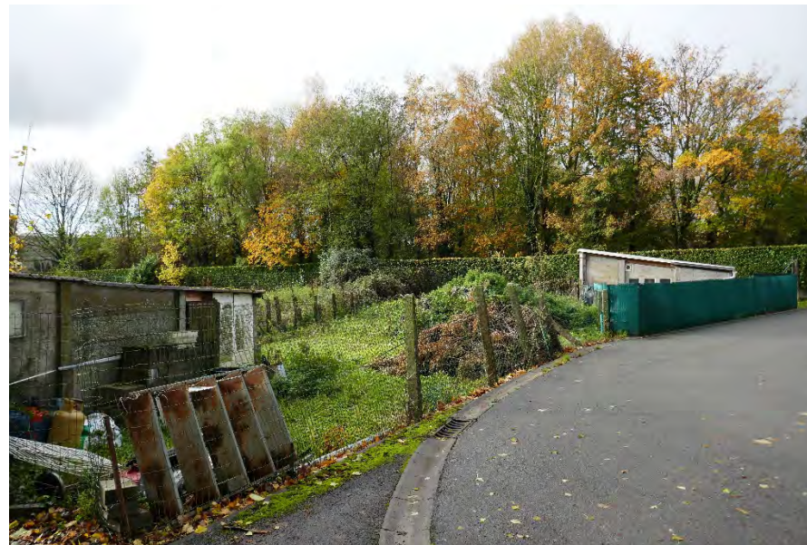
Foto 20: zone bedrijvigheid hoek Meenseweg/N8 – Steverlyncklaan: percelen 1° afdeling sectie C nrs. 37/2X2 en 37/2Y2