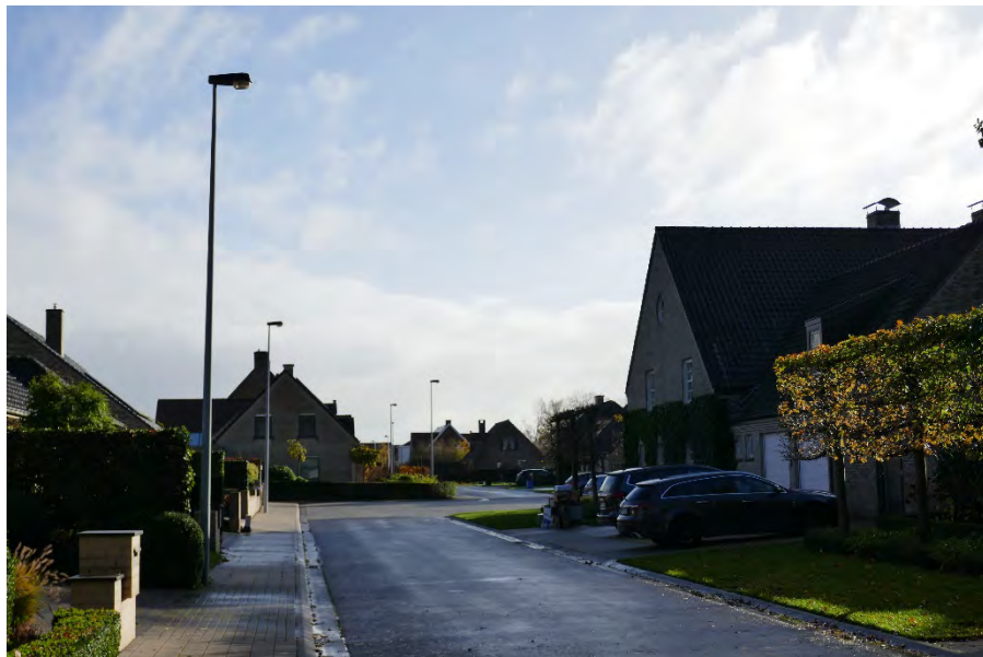
Foto 39: oostelijke woonontwikkeling: woningen Weldadigheidstraat