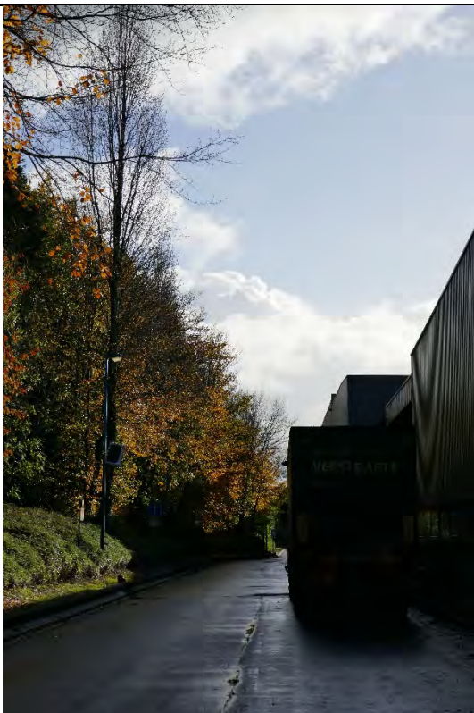
Foto 27: site Picanol: circulatieruimte en ruimte voor laden en lossen aan oostzijde