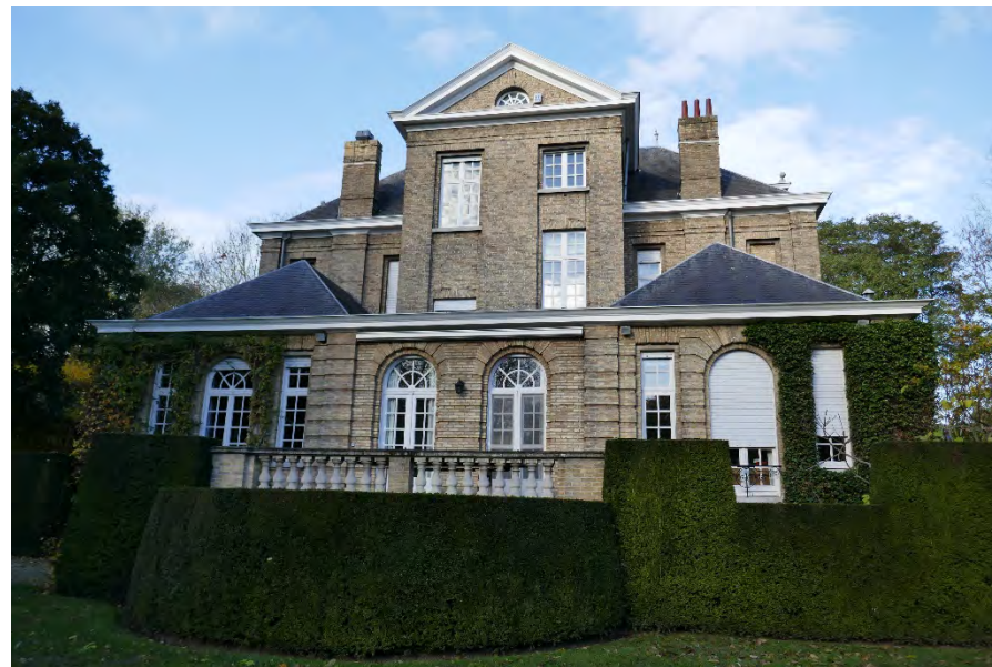
Foto 34: park Picanol met braakliggend bosgebied: landhuis – achterzijde