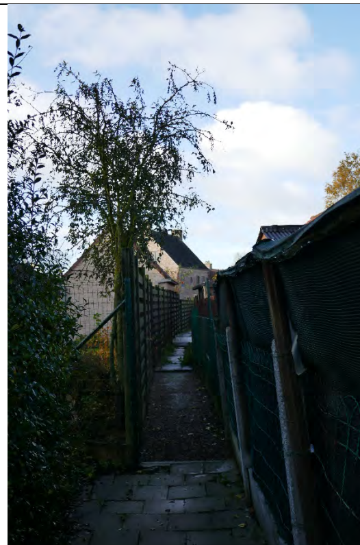
Foto 42: oostelijke woonontwikkeling: kruiwagenpad achter Meensewg 180-194 (even nummers) en toegankelijk vanaf groenbuffer uit foto 41