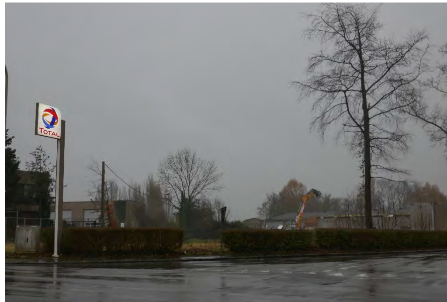
Foto 14: zone bedrijvigheid hoek Meenseweg/N8 – Steverlyncklaan: braakliggend perceel voormalige watertoren