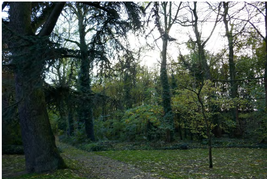
Foto 37: park Picanol met braakliggend bosgebied: tuin – zijde site Picanol