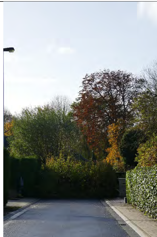
Foto 40: oostelijke woonontwikkeling: onderbroken doorgang richting doodlopende tak Meenseweg/N8