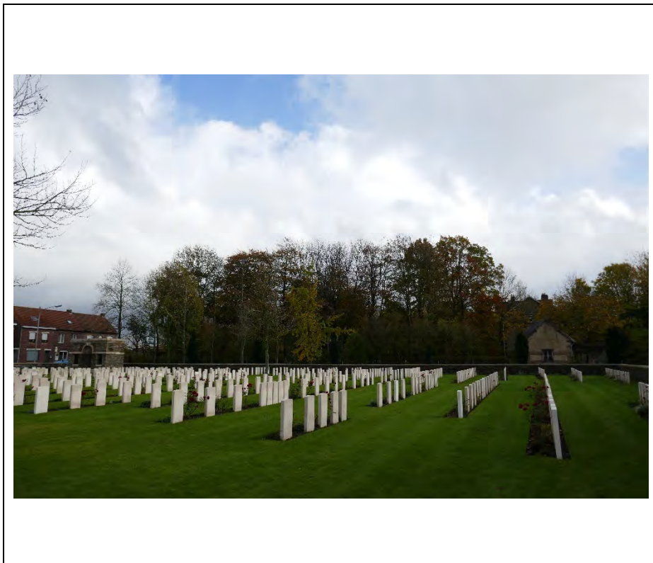
Foto 3: Meenseweg 142: parkstructuur gezien vanaf Menin Road South Cemetery