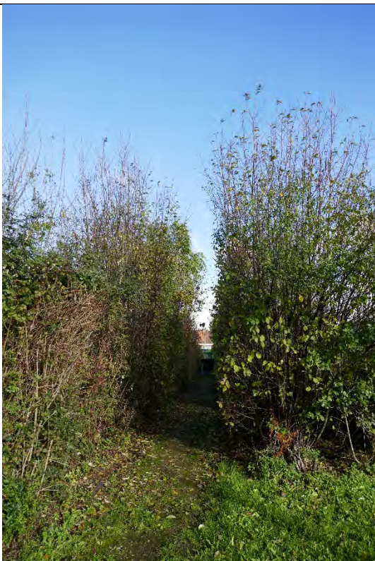
Foto 41: oostelijke woonontwikkeling: groenbuffer tussen meer oostelijke gelegen woonontwikkeling Steenovenstraat (buiten plangebied)