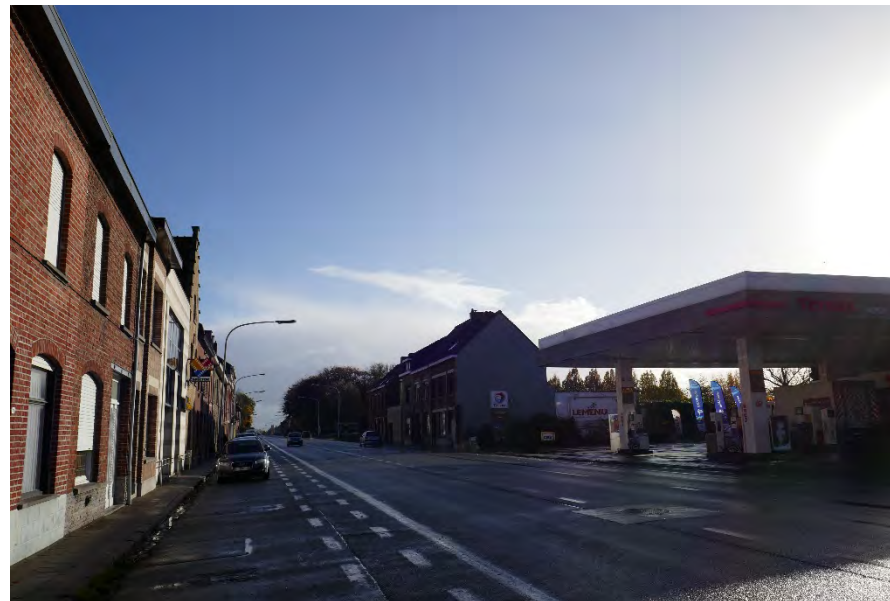
Foto 12: zone bedrijvigheid hoek Meenseweg/N8 – Steverlyncklaan: tankstation Lemenu