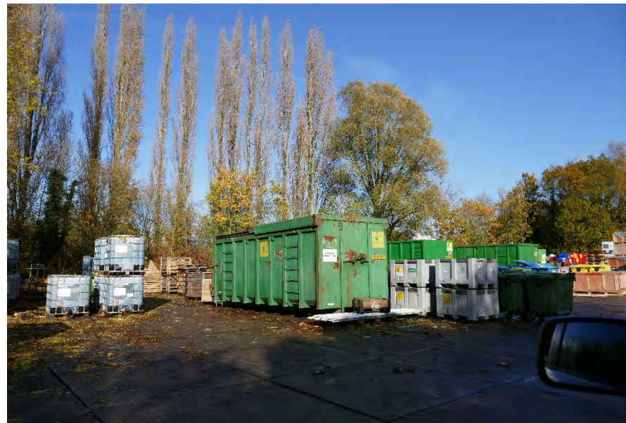
Foto 26: site Picanol: containerpark