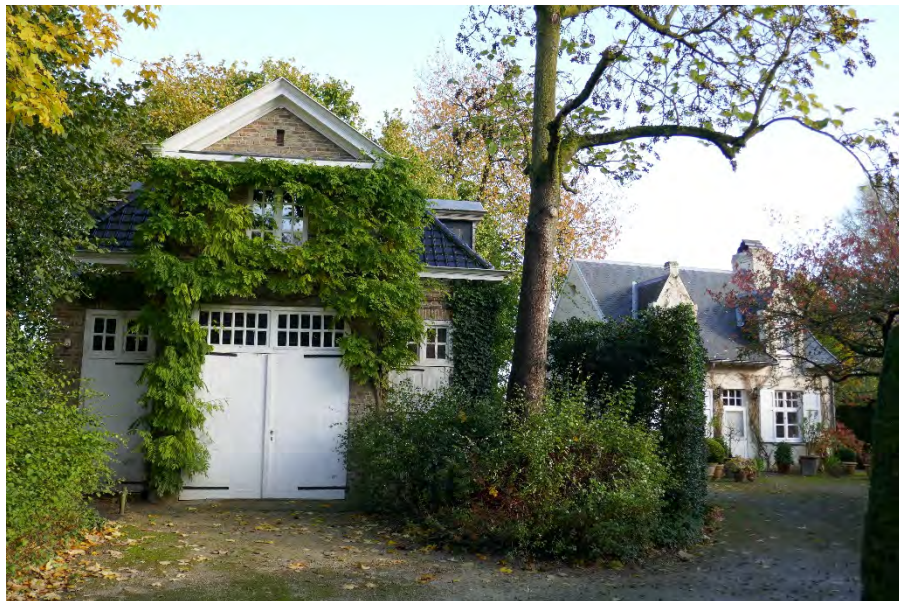
Foto 35: park Picanol met braakliggend bosgebied: koetshuis en conciërgewoning