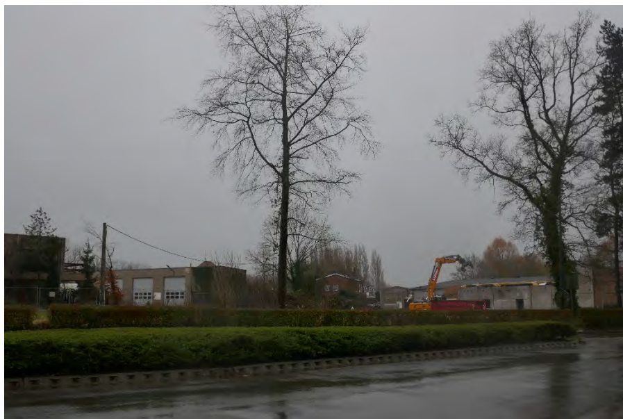
Foto 15: zone bedrijvigheid hoek Meenseweg/N8 – Steverlyncklaan: braakliggend perceel self-carwash