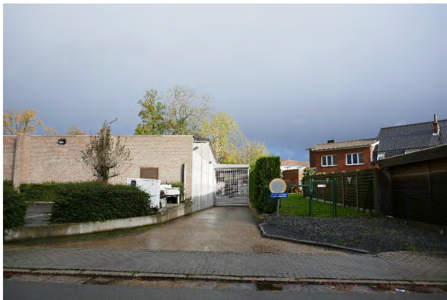
Foto 17: zone bedrijvigheid hoek Meenseweg/N8 – Steverlyncklaan: Aldi-Renmans – toegang leveringen langsheen Watertorenstraat