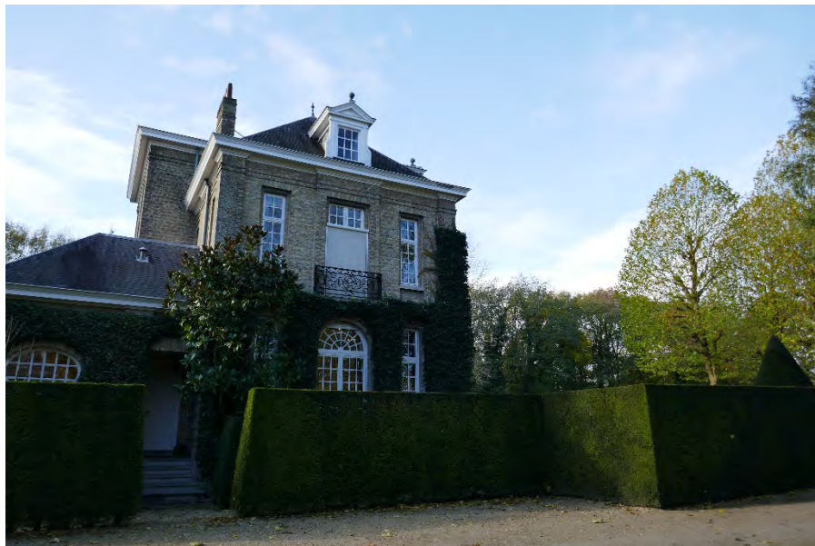
Foto 33: park Picanol met braakliggend bosgebied: landhuis - voorzijde