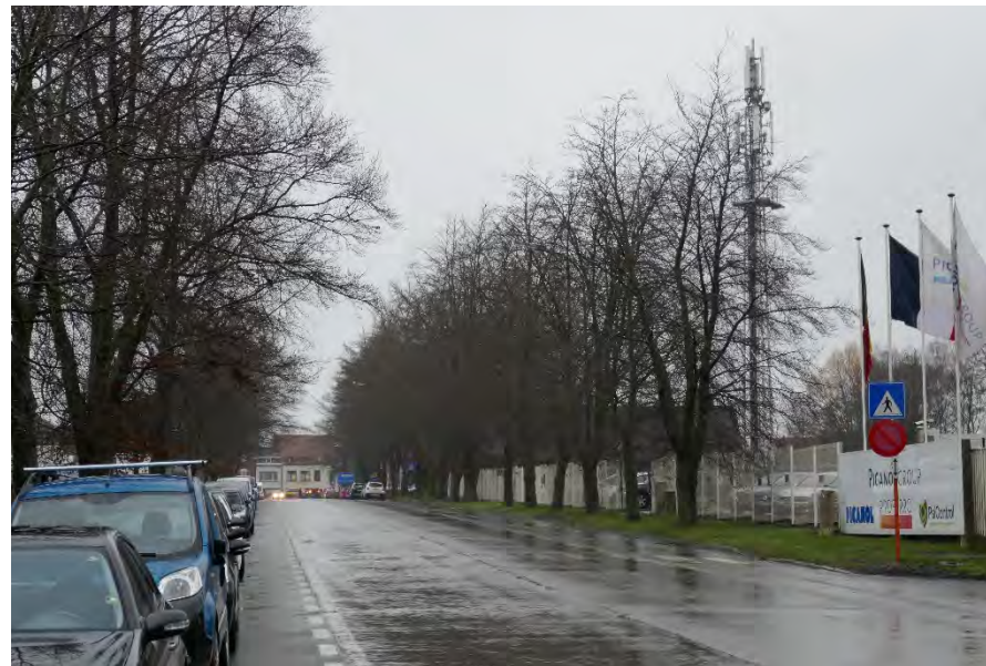
Foto 24: site Picanol: parking met toegang langsheen Steverlyncklaan