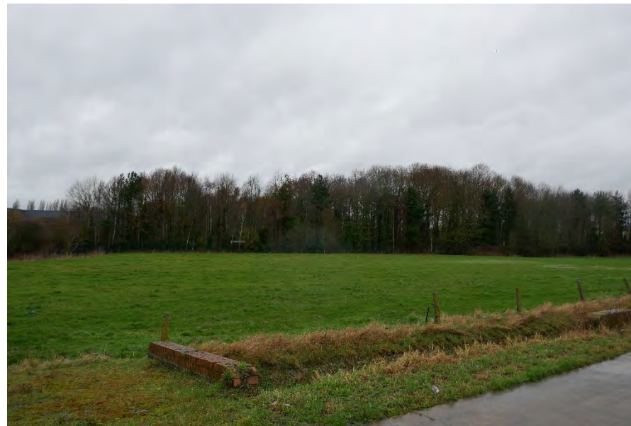
Foto 30: park Picanol met braakliggend bosgebied: braakliggend bosgebied