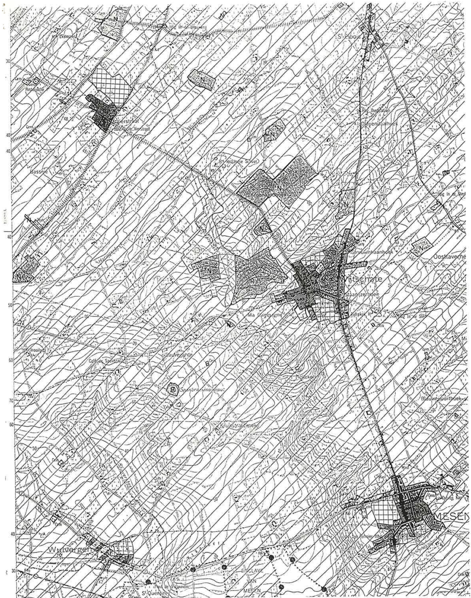
UITTREKSEL GEWESTPLAN IEPER - POPERINGE - KB: 14/08/1979