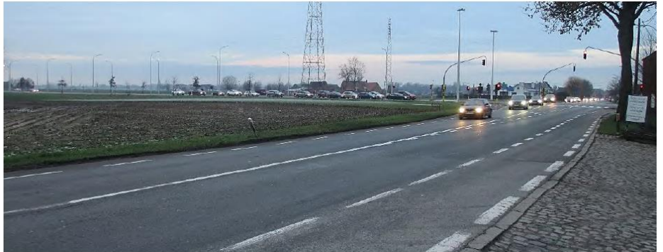
Figuur 63: N8 (Veurnseweg) richting het kruispunt met N38 (Noorderring).”

“De N8 bestaat uit twee maal één rijstrook voor gemotoriseerd verkeer en één niet-beschermd[...] fietspad, [dat van de rijstroken gescheiden is] door middel van witte streeplijnen.